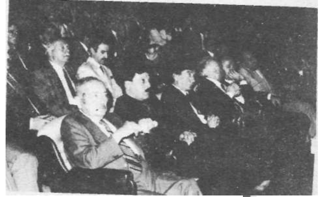
Kömür Kongrelerinin 7.'si 21-25 Mayıs 1990 tarihlerinde Zonguldak'da toplandı.

130 yaşındaki Havza, merkezini resmî bayram günlerinin görünümüne büründüren bir Kömür Kongresi ile hayatında ilk defa tanışmıştı. Zonguldak, bu olayı Öylesine bilinçle benimseyip sahfoleniyordu ki dört yıl sonra bir üçüncüsünü "Könam do ne demek? Biz sizi kapattık; sizler artık yoksunuz." diye irade buyuran bir Haşmetiü'yarağmen ilı, belediyesi, odası, derneği, sendikası, vd. ile birlikte sağlanan dayanışmanın çabalarıyla, uluslararası bir katılım sağlayarak hayata geçiriyor ve ülkenizin halen yaşadığı taşkömürü darboğazını daha o günden kamuoyuna açıklıyordu. Periyodik aksamanın, varlığı tartışmalı bir demokrasinin bile d-sının sisler ardında kaldığı bir dönemde önlenmiş olması, Eski Oda Başkanmtz'ın önceden gördüğü gelenekselleşmenin kök salmasına yol açıyor ve bir tür '•şehirleşme (ya da sanayileşme) kültürü'nün y esermesi için atılan tohumlar, yeraltı n in : en derin köşelerine kadar inerek pratik ile kaynaşıyordu. Kaynaşma gerçekten de anılmaya değerdi-zira, heihangi bir işçinin;(niteliği her ne olursa olsun), akademik düzeyi yüksek bir teknik kongrede tartışılan tebliğlerden birine imza atması, o zamanakadar, ülkenin hiçbir yerinde görülmuş değildi i;; ; Bir hisım gelip delerek geçen 80'li yılların ardından, geleneğin sürdürülmesinden sorumlu Subemz;n 1990 May.s.'nda da hayatageçirdiği kömür kongrelerinin 7-si ve Zonguldak'taki yeni gelişme- S -----Devamı 2. sayfa'da